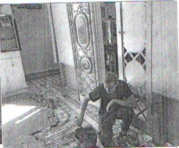
ремонт в Приходе храма новомучеников и исповедников Церкви русской станции Ленинградской