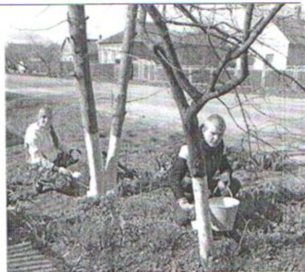
Побелка деревьев по улице Красной ст. Ленинградской